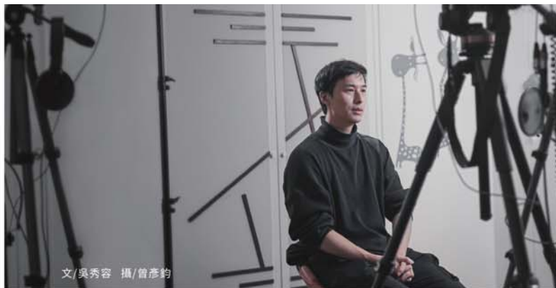
文/吳秀容