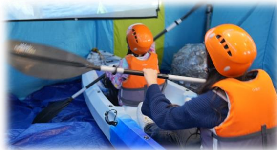
主題體驗活動 8 項