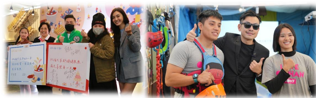
名人參與響應 4 位