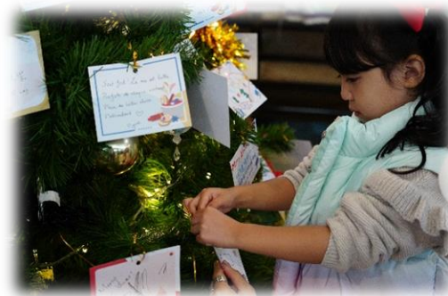
祝福行動卡片募集 552 張