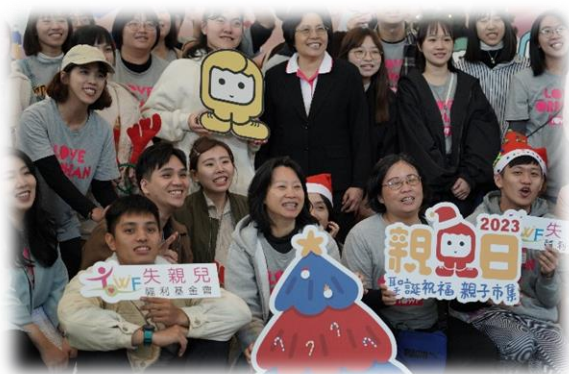
工作人員共 42 位