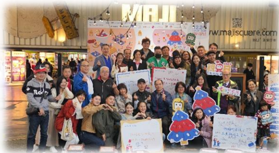
企業貴賓參與共 40 位