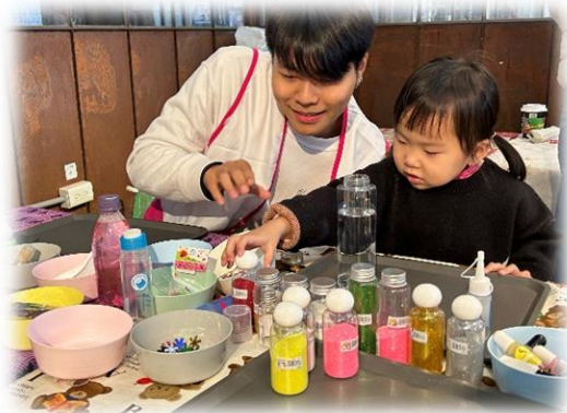
志工及個案參與共 78 位