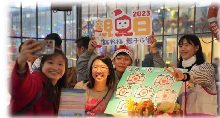
參與人次約 700 人